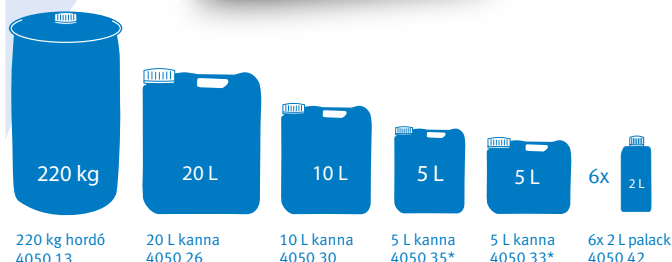
220 kg hordó 4050 13