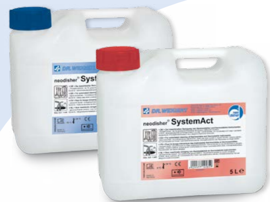
2x 5 L neodisher® SystemClean: Garrafas de 5 L 2x 5 L neodisher® SystemAct: Garrafas de 5 L