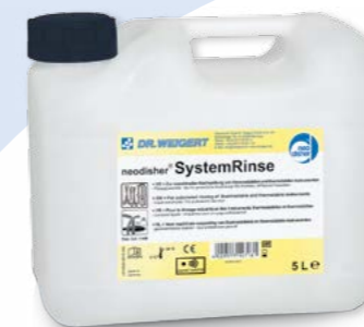
2x 5 L neodisher® SystemRinse: Garrafas de 5 L