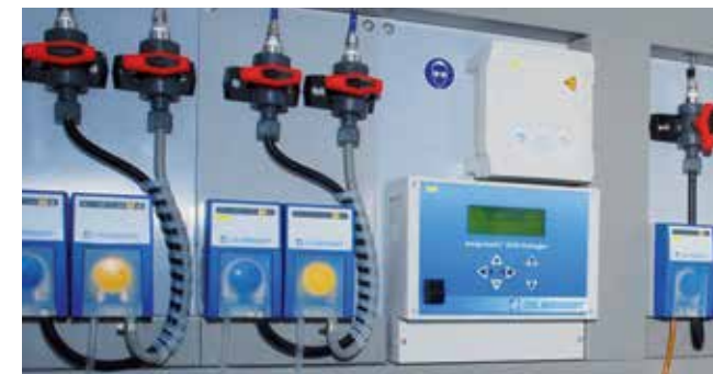
Centraal doseersysteem van Dr. Weigert

Het reinigende product wordt per slot van rekening automatisch in bijvoorbeeld de spoelmachine of het reinigings- en desinfectieapparaat gedoseerd zonder dat er iemand met de proceschemicalie in contact kan komen.