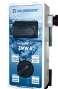
Mengapparaat van de nieuwste generatie